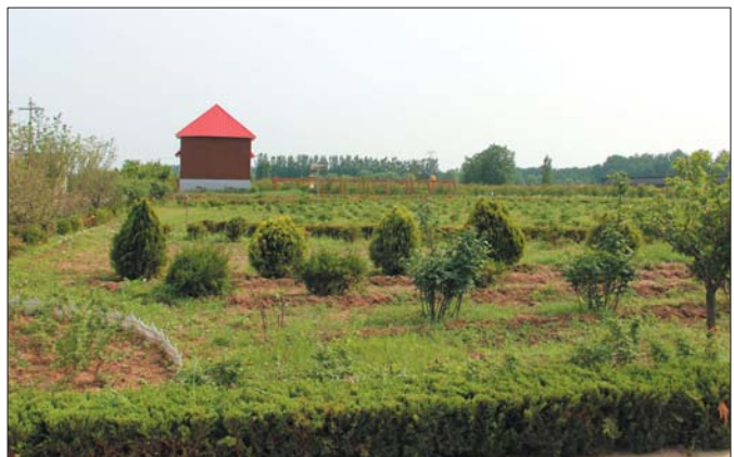
新市花谷田园综合体。

今年以来,在区委区政府的正确领导下,新市镇抢抓携河发展机遇,立足撤县划区历史新节点,充分发挥紧邻新旧动能转换先行区的区位优势,紧紧围绕乡村振兴战略发展目标,全镇党员干部群众团结一致、砥砺奋进,各项重点工作均取得了显著成效。