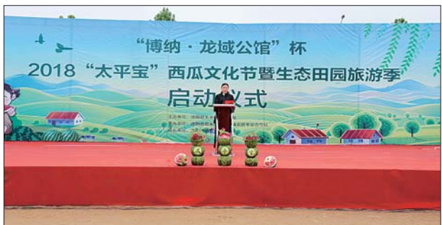
太平街道2018年西瓜文化节。

开展“出彩太平人”评选活动,推选出10名助人为乐、孝老爱亲、模范老人等先进人物,进行隆重表彰,弘扬了社会正能量。全面做好社会稳定、计划生育、民政、劳动保障、敬老院建设等民生实事,加大移风易俗、乡村文明工作力度,群众的获得感、幸福感不断增强。