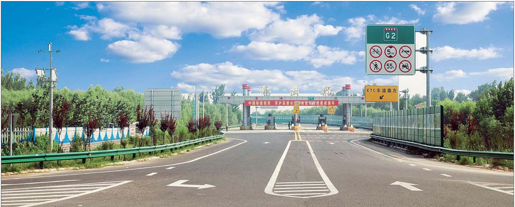
太平街道交通区位优势日益凸显。