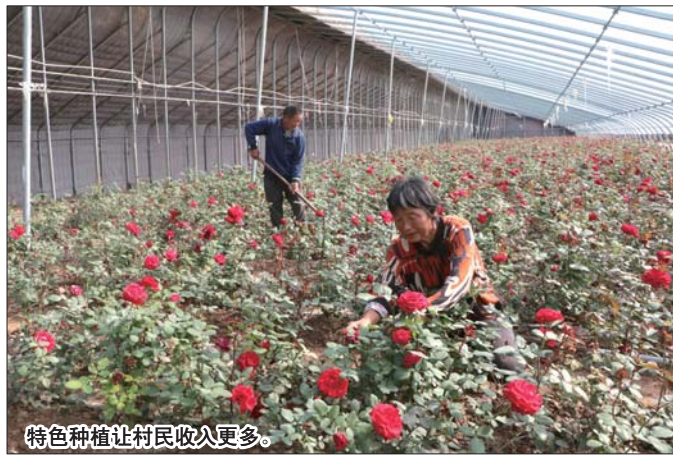
特色种植让村民收入更多。

干净的街道上,灰色的水泥路面平整洁净;广袤的田地里,鲜红的玫瑰花娇艳欲滴;农户正忙着耕种,孩子在街边嬉戏。这样一幅生动的田园风景图出现在菏泽高新区吕陵镇的大小街道。果树、玫瑰、藕塘,特色种植迎来了农村的“新风景”,种植、加工、旅游,乡村振兴填满了农民的腰包。