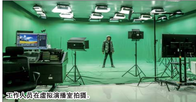
工作人员在虚拟演播室拍摄。

本报菏泽11月8日讯(记者 王雅楠)“你快走!不要管我。”几个身穿迷彩服、背扛机关枪的士兵是一家名叫山东宇生文化有限公司新鲜出炉的动画作品《国防后备军》。从初入社会的“动漫菜鸟”到扛起菏泽动漫产业大旗的领头羊,山东宇生文化有限公司用作品向菏泽动漫产业交出了一份漂亮的答卷。