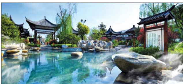
山东临沂智圣汤泉温泉泡池