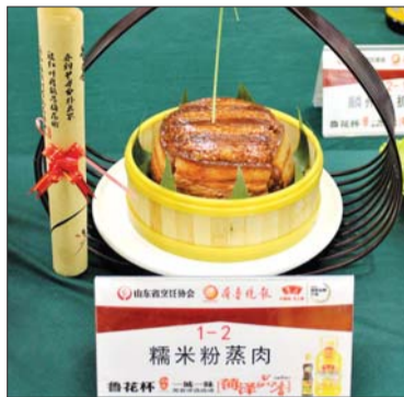
银盛国际酒店——糯米粉蒸肉

其中果仁竹节虾、糯米粉蒸肉、牡丹生炒羊羔肉、飘香驴肉、壮馍、夹沙山药等众多美食给人们留下深刻印象。现场,多位评委对40道特色菜品给予专业点评。