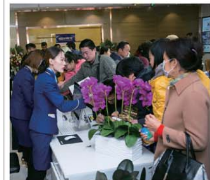
▲前来咨询活动的市民络绎不绝,预约从速。

庆口腔健康保障工程一周年,可恩口腔医院感恩回馈新老客户,与国际知名种植体厂家联合举办本次种牙得牙还返钱活动,活动已持续两个多月,数千名缺牙市民通过本次活动解决了缺牙难题,实惠种上长寿牙!本次活动以感恩回馈为主,真正做到让利惠民,目前报名持续火爆,有牙齿松动、牙齿缺失、牙齿缺损情况的患者一定尽快拨打电话报名,活动截止至12月31日,每天前十位报名的患者可免580元种植方案设计费,老顾客可享免费拔除残根、松动牙,因活动植体有限,来院前请一定拨打0531-88810555报名预约。