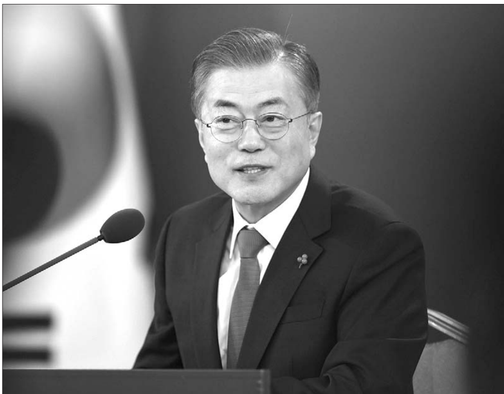
10日上午,在韩国首都首尔,韩国总统文在寅在青瓦台举行2019年新年记者会。

韩国总统文在寅10日在总统府青瓦台召开新年记者会,展望2019年韩国内政外交前景。他表示,相信第二次朝美领导人会晤临近,期待韩朝经济合作为韩国经济注入活力。文在寅说,去年韩朝关系改善取得诸多成果,相信即将举行的第二次朝美首脑会晤,以及朝鲜最高领导人金正恩访韩,将成为进一步巩固半岛和平的又一个转折点。