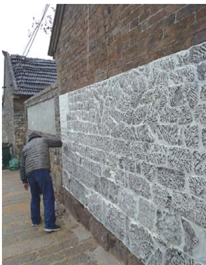
雄崖所鱼叶纹老山墙。