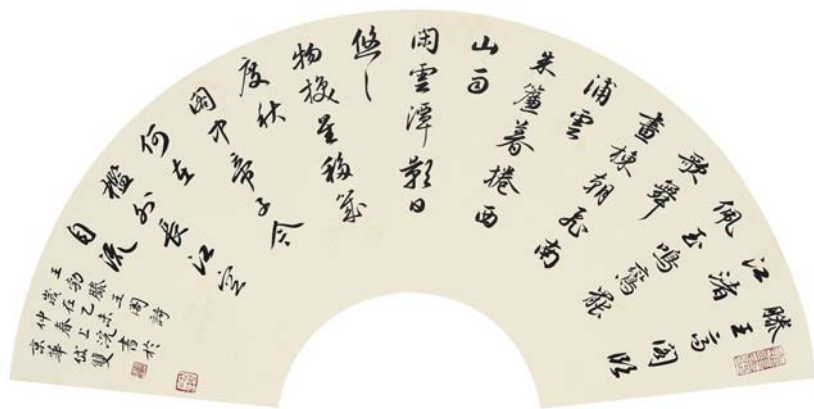
▲行书 折扇 王勃《滕王阁诗》 68x35cm