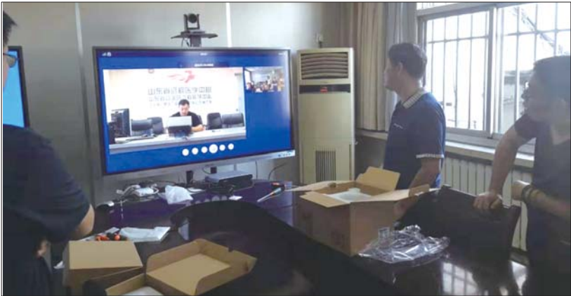
在泰安市中医二院办公场地, 工作人员紧张调试设备。

微医集团的对接力度。在微医集团计划落地泰安之初, 泰安市各级积极推进流程再造, 提升服务效能, 积极倡导项目快速落地。