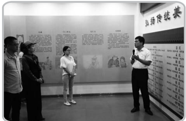
曲阜市尼山镇鲁源新村,端上行参与人员正在参观该村新时代文明实践站。

孔子博物馆也推出了夜游服务,随着去年试运行到如今正式开馆,孔子博物馆也在积极探索“跨界”,用更加丰富的形式向世人展示一场文博盛宴。孔子博物馆于2019年8月17日至10月中旬试行周六夜场开放,每周六延长开放至21点30分闭馆。夜游博物馆,正成为市民文化休闲新选择。