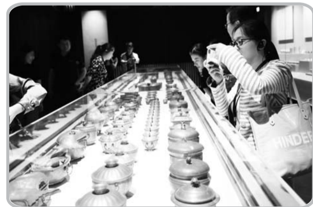
孔子博物馆内,参观者们纷纷拿出手机拍照留念。