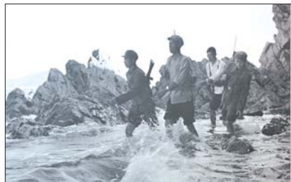
20世纪70年代,边防官兵在海岸一线巡逻。