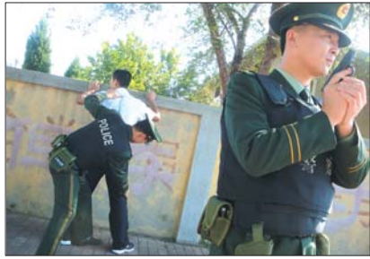
2010年,边防官兵进行搜查巡逻

与烟台市区隔海相望的崆峒岛,一直是烟台公安边防支队的管辖区域。早在上世纪60年代,边防民警就摇着小船,为岛上的群众和港口的渔民送医、送药、送邮件,几十年如一日,被国家民政部、解放军总政治部授予“海上鸿雁”荣誉称号。随着时代的变迁,边防派出所的民警们不断创新便民、为民服务举措,得到了群众的信任和赞誉。