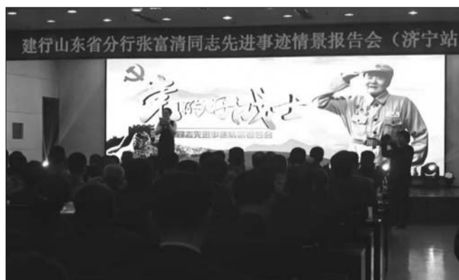
建行山东省分行张富清同志先进事迹情景报告会现场。

建行济宁分行党委书记、行长袁雪峰说,张富清同志先进事迹感人至深、催人奋进,报告会既是一堂特殊党课,也是一次思想洗礼。“济宁分行将持续在全辖加大先进事迹宣传力度,努力把学习成果转化为工作实效,在全行迅速掀起‘学英