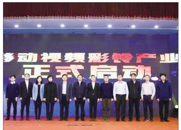
山东移动“5G视频彩铃”产业联盟在济宁正式启动。

本次活动受到济宁市委市政府领导、5G视频彩铃产业联盟成员、山东移动政企客户的高度认可。