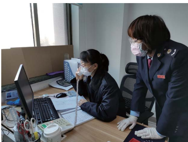
纳税人提供税收政策的远程电话辅导。