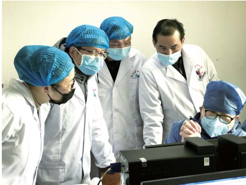
在黄冈,济宁医学院附属医院援助湖北医生在讨论病人病情。

这是一场没有硝烟的战争。从新冠肺炎疫情暴发开始,济宁医学院便展开了全线抗“疫”。在济宁医学院附属医院,除全院医护人员投入到抗“疫”一线外,从1月28日起,先后两批派遣18位医护人员分别驰援黄冈和武汉。