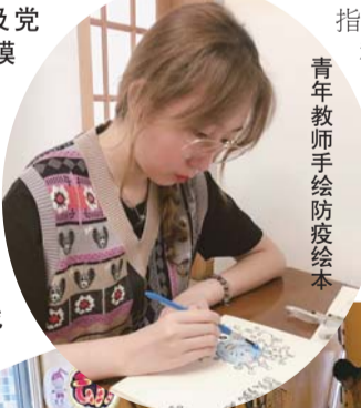
青年教师手绘防疫绘本

自新冠肺炎疫情发生以来,济南市天桥区实验幼儿园坚决贯彻落实上级有关决策部署,充分发挥党支部战斗堡垒及党员干部先锋模范作用,结合幼儿园实际,把防控工作落实做细。全体教职员工统一思想,提高站位,各司其职,共答战“疫”之卷。