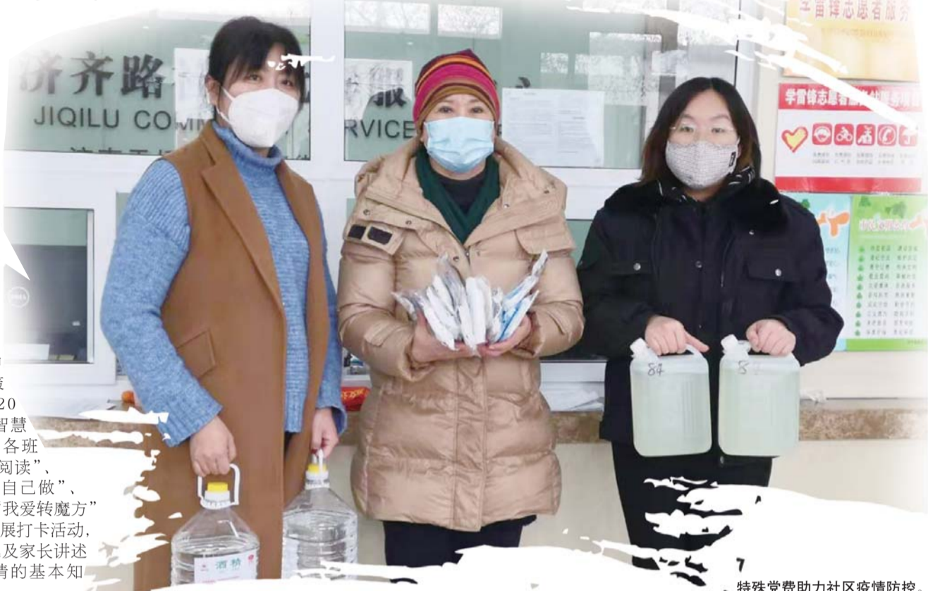
特殊党费助力社区疫情防控。

为科学规范地做好防疫工作,新冠肺炎疫情发生后,济南市天桥区幼教中心实验幼儿园立即成立疫情防控工作领导小组,积极开展线上科学指导,为家长的陪伴支招,为幼儿的成长助力,用自己的实际行动坚守在幼儿园防控一线。