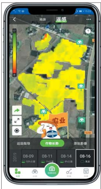
在手机能看到作物长势。

继3月5日中央电视台中文国际频道报道之后,3月6日晚,商河县孙集镇利用智慧农业抢抓农时春耕的创新做法登上了央视《新闻联播》。当春耕与疫情撞车,机械化与智能化工作成了当下春耕生产的新趋向。当前形势下,孙集镇与中化农业强强联合。在孙集镇,一部智能手机就可以帮助农户全域全力做好春耕的保耕备耕服务工作,做到“防疫情、保供应、稳价格、助三农”。