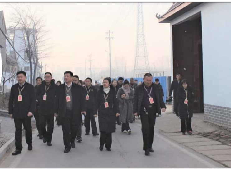
街道领导班子和人大代表、政协委员一起调研美丽乡村建设项目。

栽种各类绿化苗木2万余株。投资2000万元对驻地富源路、杨肖路进行全面升级改造，目前主体工程已经建成通车。大力推进无违河湖和“清四乱”工作，共拆除违章建筑3万余平方米，围墙3000余米，围挡1000余米。