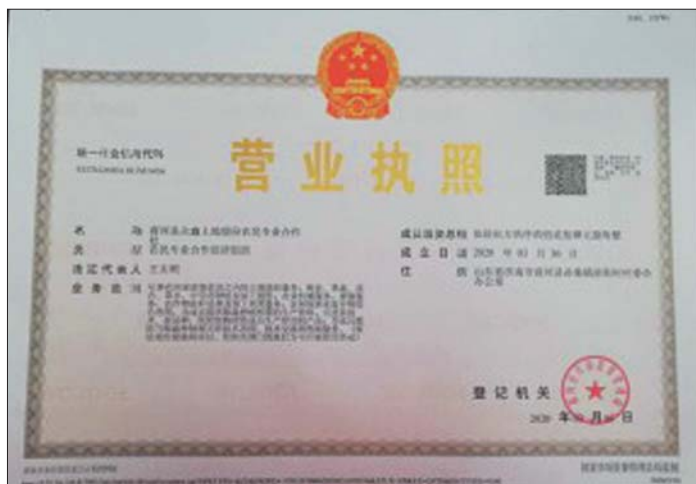
全县首家土地股份合作社“执照”。

支部领办合作社,是今年商河县重点抓的一项基层党建工作。围绕支部领办合作社干什么,怎么干,近日孙集镇交了“作业”——成立全县首家土地股份合作社,打造“党委支持-支部领办-合作社运营-服务组织托管-集体增收+群众致富”的孙集模式,激活了乡村振兴新动力。