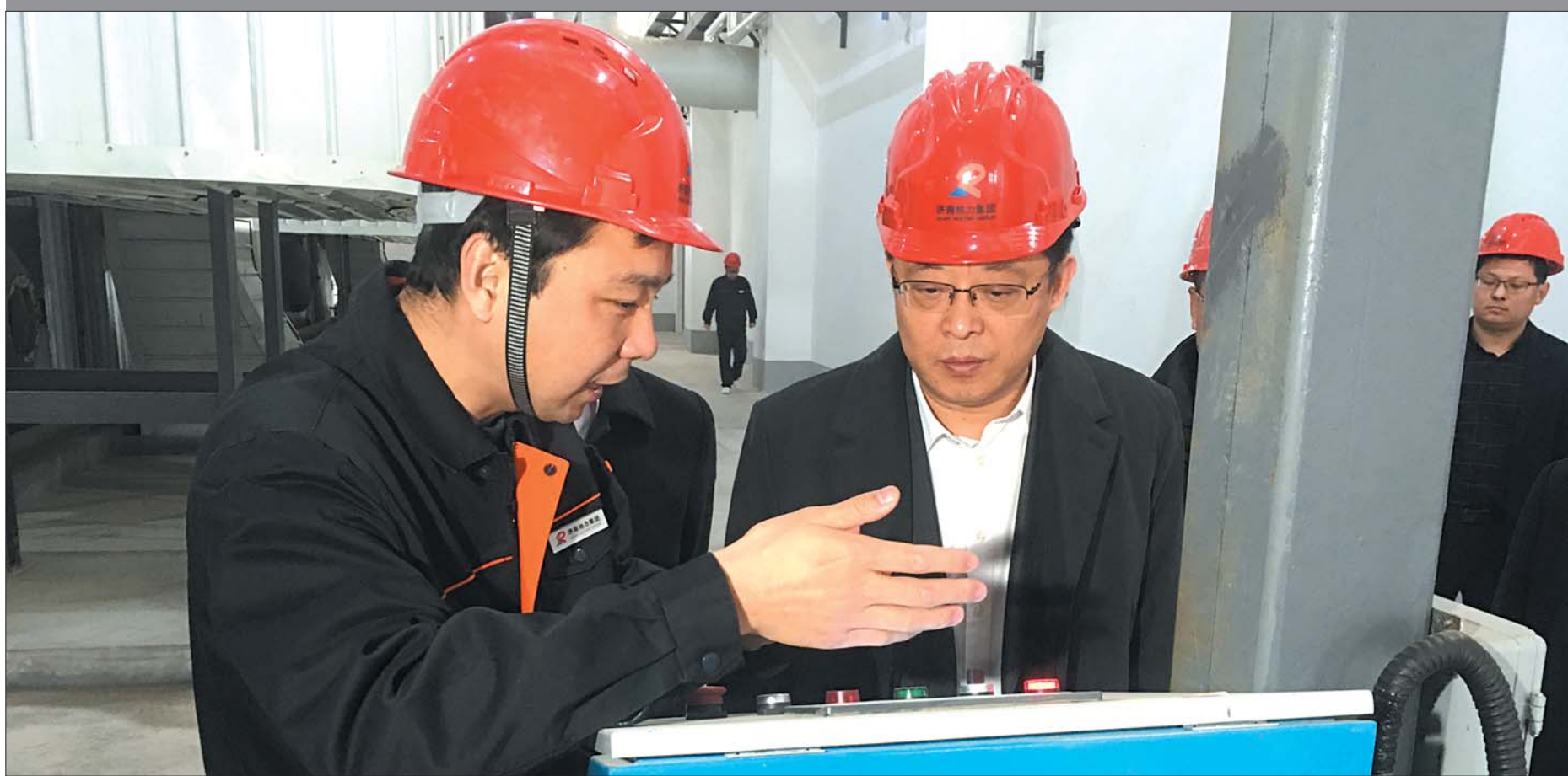
县委书记翟军来恒泰指导工作。