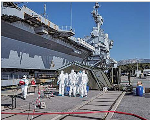
“戴高乐”号航母4月12日回到法国南部土伦军港后,舰上官兵下船接受隔离观察和治疗。

据美国有线电视新闻网(CNN)网站20日报道,法国总理菲利普今年1月在“戴高乐”号航母上发表讲话,称赞这艘航母就像是“法国王冠上的宝石”。当时,“戴高乐”号即将前往东地中海执行任务,菲利普说:“请放心,国家正关注着你们,并为你们感到骄傲。”