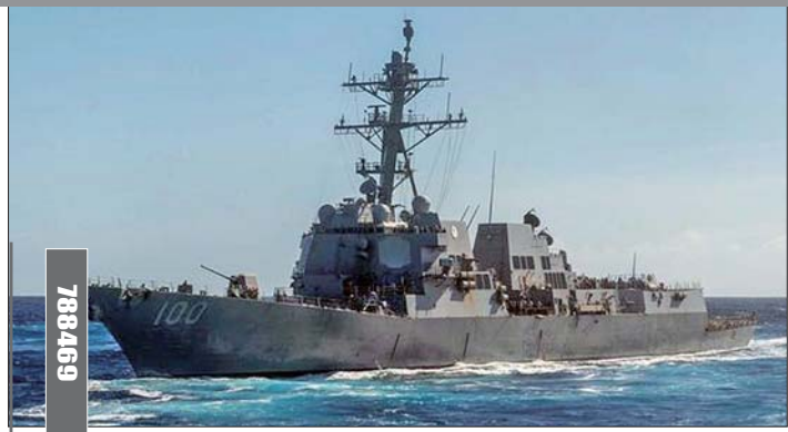
美军“基德”号驱逐舰。

路透社报道,疫情正在“大面积摧残”英国经济,约翰逊面临担任首相以来的最大难题:如何逐步“解封”限制措施,同时避免疫情二次暴发。英国国家统计局办公室24日发布的的数据显示,英国零售销售量3月较2月下降5.1%,为该机构1996年成立以来最大环比降幅。凯投国际宏观经济咨询公司经济学家皮尤说:“英国零售支出4月较3月可能下降20%至30%。”