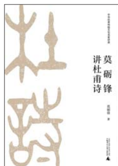
广西师范大学出版社 莫砺锋著 《莫砺锋讲杜甫诗》