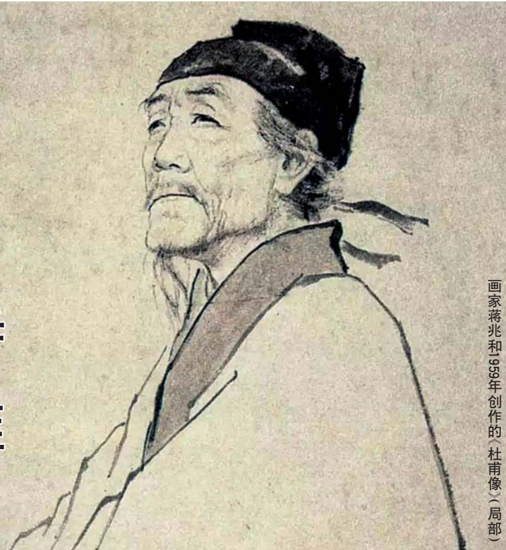
画家蒋兆和1958年创作的《杜甫像》(局部)