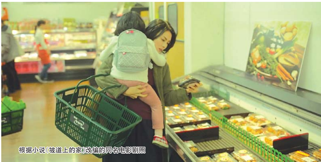
根据小说《坡道上的家》改编的同名电影剧照