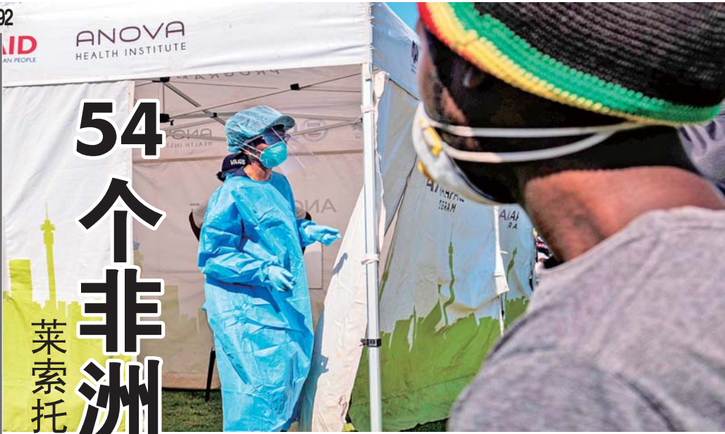
5月8日,在南非约翰内斯堡,一名医务人员在新冠病毒检测站工作。