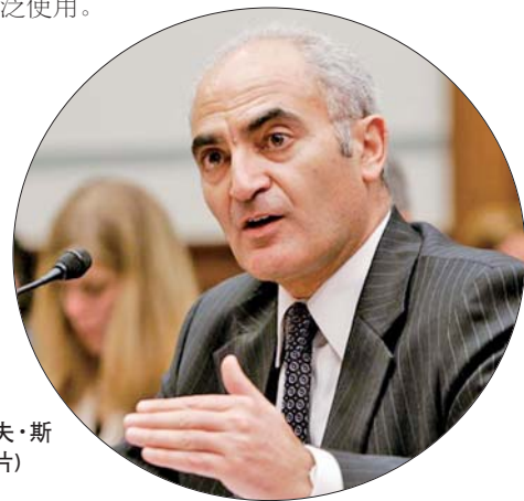
蒙塞夫·斯拉维(资料片)

“曲速行动”所作疫苗研发时间规划凸显勃勃雄心。公共卫生官员3月说,疫苗研发可能耗时长达18个月,一款疫苗被证明有效后,可能需要数月甚至数年才能获得广泛使用。