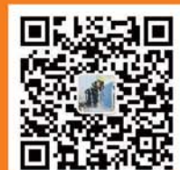
菏泽消防微信二维码