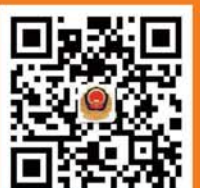
菏泽消防微博二维码