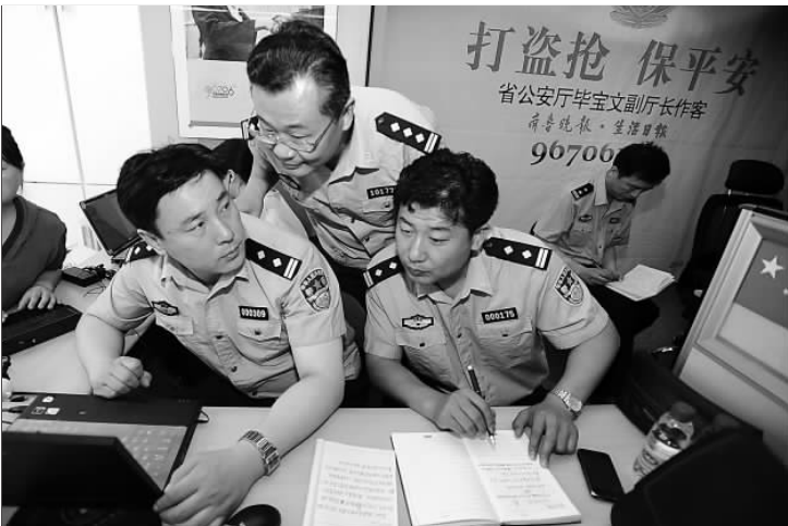
警官们现场讨论读者热线反映的问题。