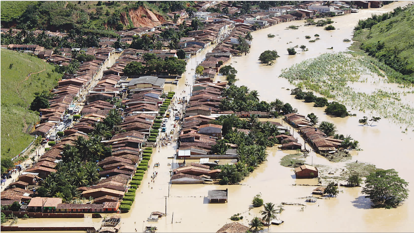
6月20日,巴西东北部阿拉戈斯州雅库伊皮的一些房屋浸泡在水中。