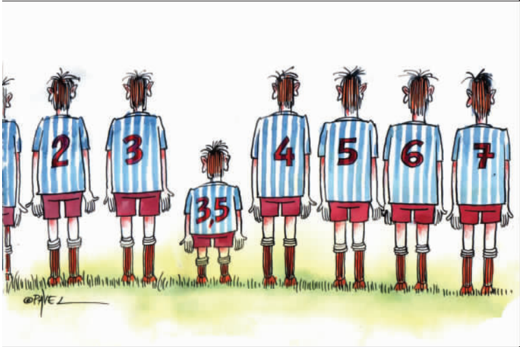
半号球员 帕维尔 (罗马尼亚)