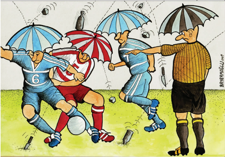
防暴装备 雷赛普 (土耳其)