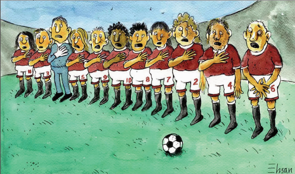
未上阵时先怯场 艾珊 (法国)