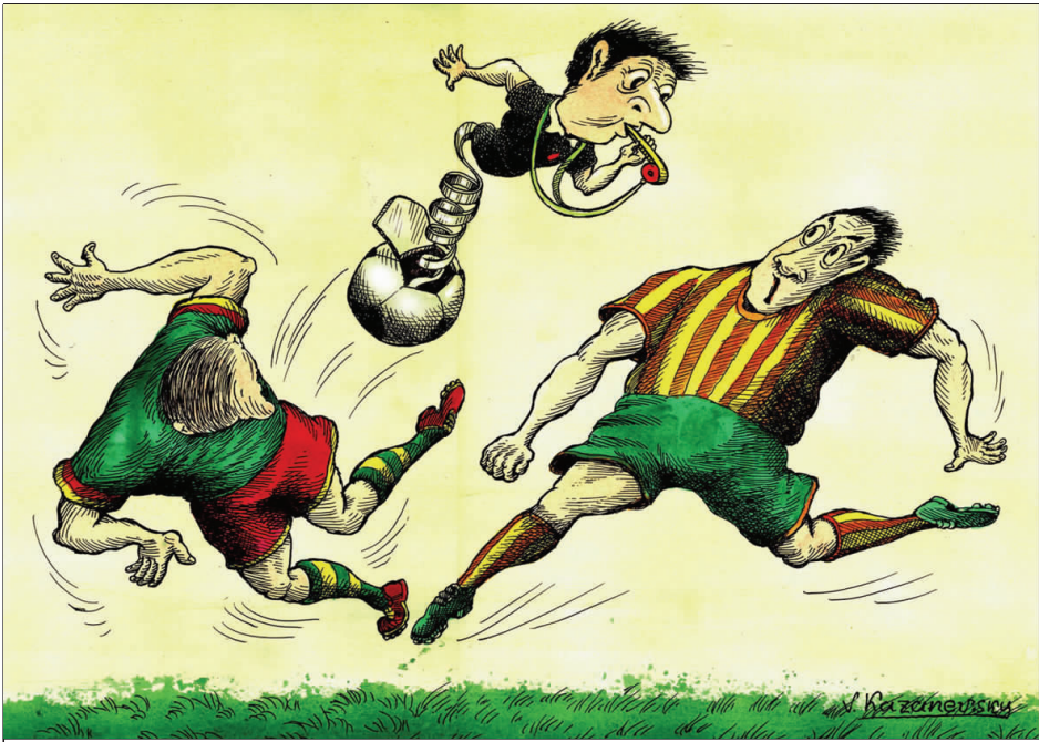
明察秋毫 卡赞尼夫斯基 (乌克兰)