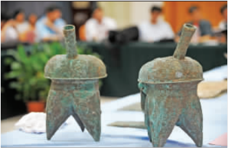
山东首次发现的两件铜盃