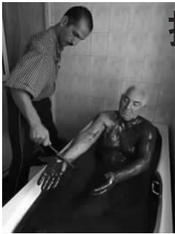
阿塞拜疆怪相——“石油浴”

各种病菌、真菌引起的皮癣、花斑癣、手头路癣、股癣、鱼鳞癣、神经性皮炎、脂溢性皮炎、过敏性皮炎、痤疮、酒糟鼻、皮炎、湿疹、皮肤骚痒、银屑病等患者