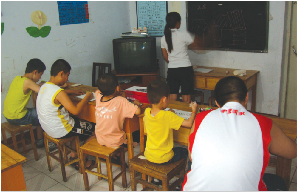
一群患自闭症的孩子在上课 孩子有大有小