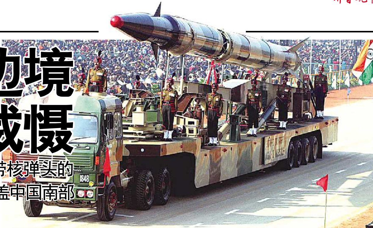
▲印度烈火-2导弹。(资料片)