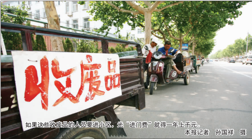
如果这些收废品的人员要进小区，光“进门费”就得一年上千元。

“我们要跟小区签合同，一次性上交一年的，年满之后可以续约。”一小区“常驻破烂王”马师傅说，刚“承包”时小区才新建起来，还能收到不少建筑垃圾和居民装修废品，比较有赚头。但现在多数住户都装修完了，他只在周末进小区收，平时在街上转。“交给物业那么多钱，价格上肯定跟在外面不一样”，他说，自己一年需上交给小区物业3600元钱，这些钱终归要从小区业主那赚回来。