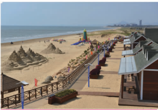
文登南海金滩一角

文登是中国少有的四季养生福地，城市绿化覆盖率达到 46%，空气质量良好率达 100%。城市各项功能完善，文登学公园、抱龙河公园、峰山公园是市民的休闲乐园，可容纳 3 万人的体育公园，万人的职教中心，集文化馆、图书馆、科技馆为一体的市民文化中心，集博物馆、