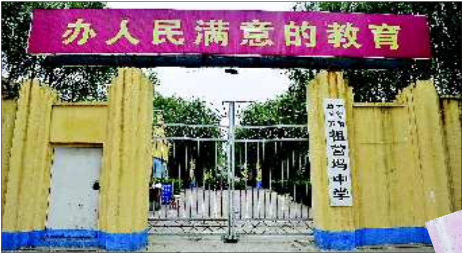
祖营坞中学大门紧锁。

本报济南8月31日讯(记者 姬生辉) 9月1日开学,但济南章丘普集镇祖营坞中学的350多名学生却慌了神——他们就读的学校没有了。早在十多天前,祖营坞中学就已“人去屋空”。普集镇教育办公室表示,因学校拆迁学生将“集体转学”,但老师忘了通知。 万山村位于章丘市东北部,共有400多户村民。30多年来,村里的孩子都在3公里外的祖营坞中学读书。村民们说,“这所学校虽小,但教学质量我们信得过,近些年走出去的大学生都在这里念初中。现在村里有60多个孩子在祖营坞中学上学。” 据了解,祖营坞中学共有350多名学生。村民李贵香(化名)16岁的女儿孙明在祖营坞中学读书,开学后上初三。“7月11日放假时,老师没说学校要搬走的事。”孙明说。 李贵香拨通了女儿班主任的电话,得到的答复是——“我已经调到别的学校了,祖营坞中学将搬迁,学生们将集体转到镇中心中学。” 8月31日下午,记者透过祖营坞中学紧锁的铁门看到,面积不大的校园内建有四排平房教室,不少教室的门已经卸去,屋内空空如也。 记者采访了普集镇教育办公室主任李荣华。李荣华说,祖营坞中学的老校舍已经建成30多年,不少教室都存在漏雨、墙裂等现象。出于对学生安全的考虑,7月中旬,章丘市教育局决定对该中学进行全面拆迁,并决定将该校350多名学生转移至普集镇中心中学就读。 李荣华还告诉记者,他曾于8月21日召集祖营坞中学的30多名老师开会,要求将此信息及时传递给学生,“可能是由于老师们忙于工作调动,疏忽了。我们将立即派人挨家挨户通知每一名学生。” 8月31日18时,记者拨通学生家长李贵香的电话得知,学校已经通知村里的学生9月1日7时30分到镇中心中学操场集合。