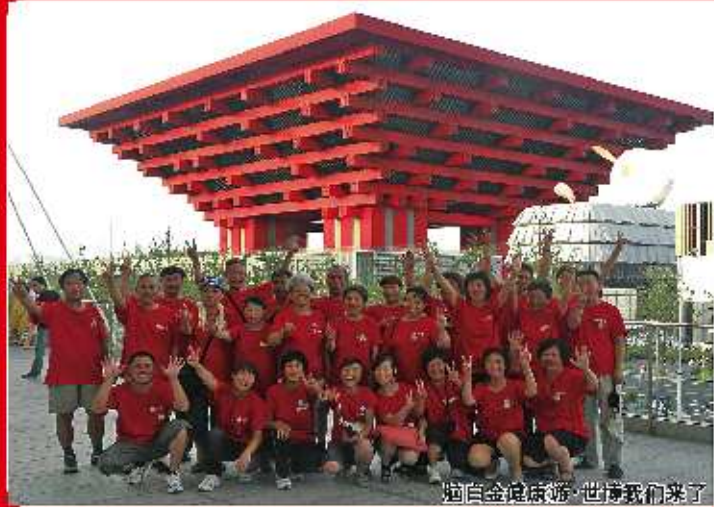
脑白金健康游·世博我们来了