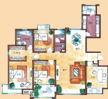
凡尔赛 四房二厅二卫 约183m²