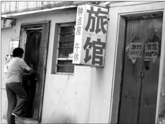
尽管家庭小旅馆存在卫生和安全隐患,但其低廉的价格仍然有不少“市场”。

“只要有闲置的房屋,经营者就可以用来开设小旅馆,不需要太大的投资和专业技术,仅仅简单地安置部分家具就可从事经营。在这样低的门槛下,就使小旅馆从业人员具有成分复杂、文化层次低的特点,他们对管理抵触情绪很多,管理起来很不容易。”相关部门已着手调查,准备整治。