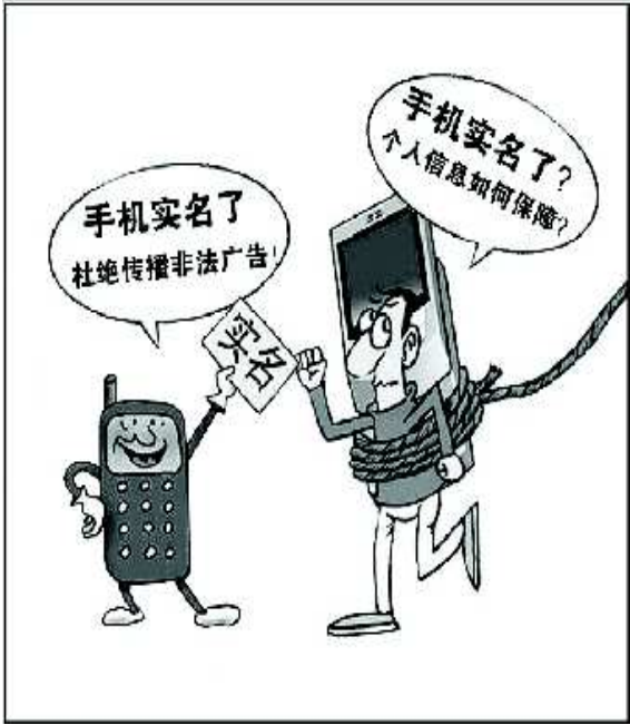
今天起,办手机卡要实名登记了。 制图 叶成虎

证的真伪。去年,中国移动聊城分公司还与公安部门联合,新开通一个市民身份证验证系统。即使是这样,他们也无法百分百地确认市民身份证件的真伪。 此外,一个身份证可以办理多个手机卡,也增加了运营商的监管难度。