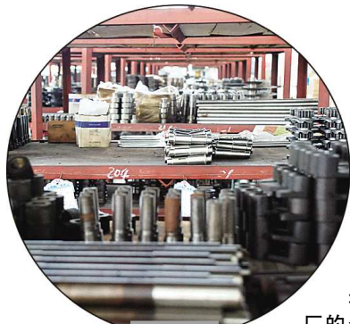
机床厂的仓库里,排列着当地产业链下游企业的供货。

“中小机床已经成为滕州城市的代言产品。市里今年年初提出,要以机床作为拳头产品,集中整合人、财、物资源,未来打造一个产值过千亿元的机械产业集群。”周天民告诉记者,“原来一听有些晕,但细算下来,还是很有信心的。虽然全国机床产值只有3800亿元,但全国机械行业总产值超过10万亿元,从10万亿元里挖出1000亿元来,并不是梦想。”