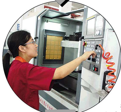
数控机床能精确到毫米级的加工精度。