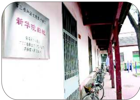
这排老房子是目前新华院的唯一遗存。