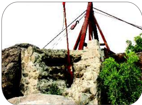
药山主峰上的日军工事残体仍十分坚固。