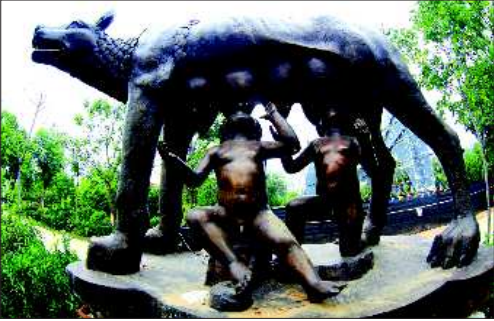
▲意大利首都罗马城标《母狼育婴》。