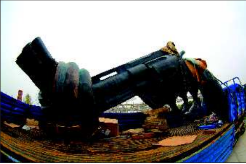
▲和平主题园区雕塑《弯曲的手枪》。