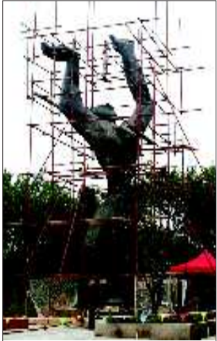
▲雕塑《被摧毁的城市》。