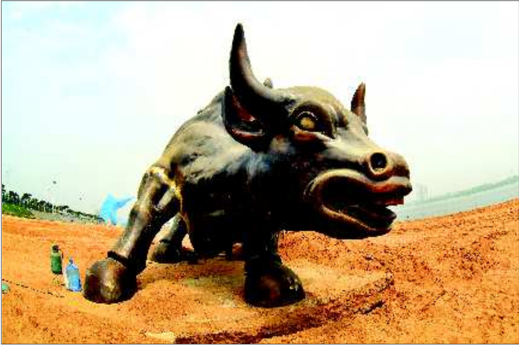
▲沙滩雕塑园区雕塑《牛》。