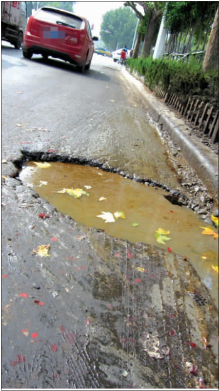
不等走进,就能闻见虞河路路边的油坑散发出一股异味。

记者了解到,潍坊是全省为数不多的几个没有餐饮垃圾处理办法的城市之一。本报记者 张焜 陈伟