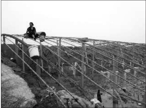
8月23日,一场暴雨过后,冠县梁堂乡邹六庄村的大棚受灾严重,50多个大棚倒塌。(本报资料片)

今年上半年聊城天气偏干,春季出现“倒春寒”,8月份又连续遭遇强降雨。气象专家预计,今年聊城天气异常,可能还会出现秋汛和冬季强降温。在恶劣天气面前,菜农承受着自然和市场双重风险,但几乎所有菜农都没入有关保险。菜农盼望能有合适的险种,手拿保单种菜,心里更踏实。