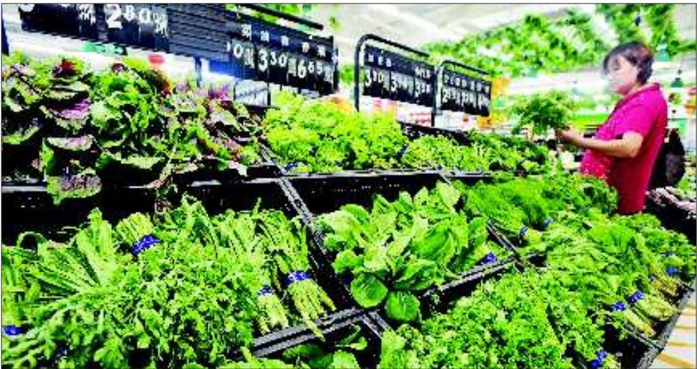
不少市民都习惯了到超市里购买蔬菜。