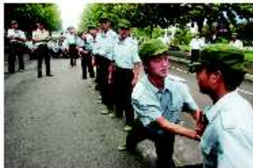
丰富多彩的军事游戏