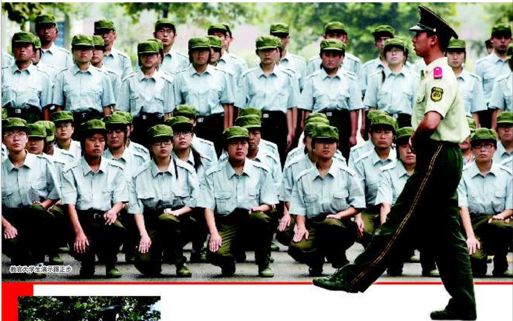
教官为学生演示踢正步