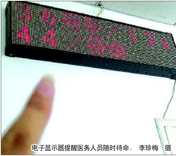
电子显示器提醒医务人员随时待命。

了一会儿到饭点了,问妻子“是现在做饭,还是等会儿。”妻子却没答应,推了推,发现还是没反应,看到地上装安眠药的小纸袋子空了,才慌了神,立即拨打120。 急救医生对王女士进行了心电、血压测试,发现王女士心脏、呼吸、血压都没有问题,喝的量应该不多,只是一直处于昏睡中,没有生命危险。王女士随后被抬上救护车,送往浮新医院治疗。