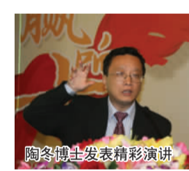
陶冬博士发表精彩演讲

周一午后,银行股出现猛烈反扑,推动大盘翻红,在这样一个“贴近节假日”的交易日里出现还是比较少见的。鉴于目前银行股的总体形势,出现连续大幅反弹的行情可能性依然不大,这样的走势若能蔓延到所有权重股,也不过就是一个“护盘”性质的走高。因此,不要把银行股当成救命草,因为银行股还不具备能救大盘的能力,市场还有内在的调整要求。虽然题材股仍在孜孜不倦地寻找亮点,但个股活跃度已明显下降。同时,农行破发和工行等金融股频现调整低点,对市场人气及机构信心打击很大。目前机构做多信心不足,空仓者还是不要参与鸡肋行情;而中线持股者可继续持股,毕竟离国庆假期还有5个交易日,到时再做打算也不迟。(和讯)