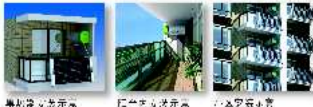
壁挂式安装示意图 阳台式安装示意图 分体式安装示意图