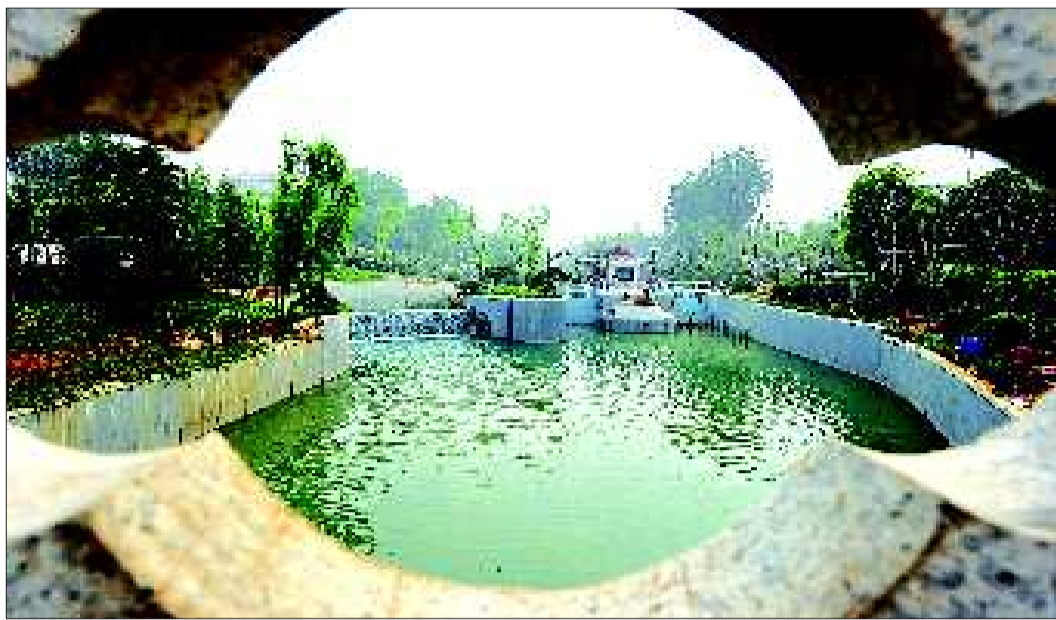
东护城河船闸建设接近尾声。

泉水浴场的建设广受市民关注,历下区体育局搬迁后已经完成土地整理,浅水区建设已正式开工。青年游泳池东侧的二层建筑顶层已经完成清理,目前正在改建成仿古式建筑。泳池南岸将按照园林风格,建造一座四五米高的假山和古色古香的凉亭,池边还要修建木栈道,泉水从假山上泻而下,形成瀑布景观流入浴场。泉水浴场将建设一个进水口,24小时不停地向浴场注水。